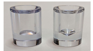
ウェット捕集用 バイアル