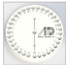
ドライ捕集用 32ウェルプレート